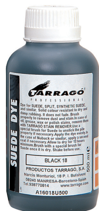
SUEDE DYE Арт. TPP16, флакон 500 мл., черный, т. коричневый, т. синий.